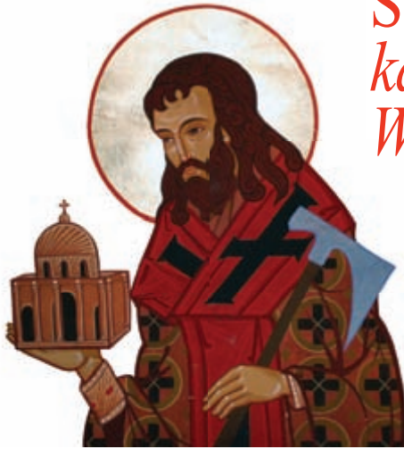
Ikone aus der Byzantinischen Kapelle am ITI-Campus

Ein Zeichen der Hoffnung, das die ganze Kirche stärkt.