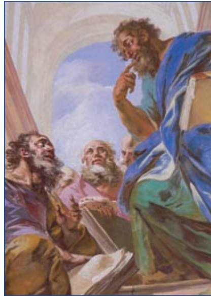
Aristoteles: Barocke Bibliothek, Kartause Gaming