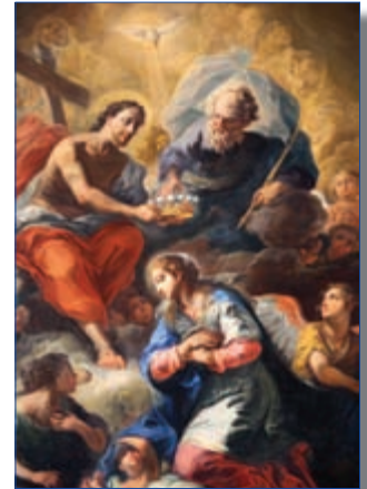
Detail aus dem Altarbild

Sobald die Bauarbeiten gut vorankommen, ist eine feierliche Weihe des neuen Campus-Geländes und seiner Gebäude geplant, zu der alle unsere Freunde und Wohltäter herzlich willkommen sind! Eine schöne Gelegenheit, mit eigenen Augen zu sehen, was für ein Projekt hier im Werden